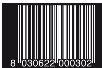
CODICE A BARRE PER MATERIALE TRASPARENTE STAMPA IN BIANCO