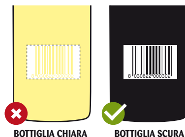
BOTTIGLIA CHIARA BOTTIGLIA SCURA ETICHETTA TRASPARENTE STAMPA IN BIANCO